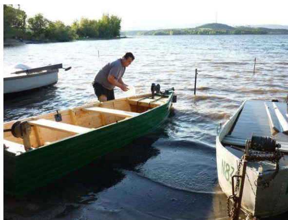
uprostřed odcizená pramice

2) Pachatel pod obcí Poláky na břehu Nechranické přehrady odcizil dřevěnou pramici ukotvenou v kotvišti, která byla připevněná řetězem k zatlučeným kolíkům, čímž poškozenému způsobil škodu ve výši téměř 17 tis. Kč. (tr. čin).